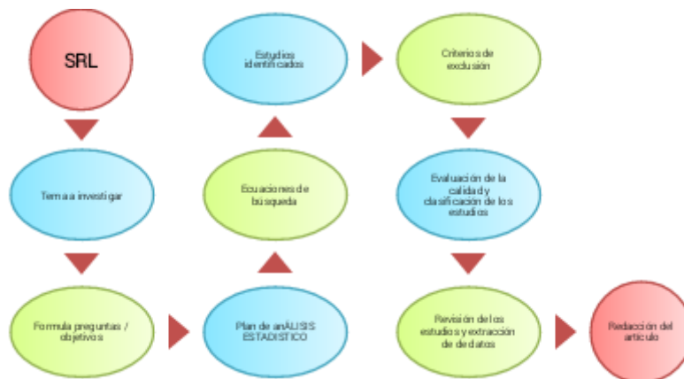
Figura 1. Diagrama de la metodología de investigación SRL

Se realizó un estudio descriptivo con el objetivo de determinar las dimensiones más utilizadas para evaluar el estrés académico, y los indicadores más utilizados para evaluar las reacciones del estrés académico relacionado con el rendimiento de los universitarios en tiempos de COVID-19. se ejecutó una búsqueda sistemática de literatura relacionada con la tematica objeto de estudio, teniendo en cuenta los lineamientos sugeridos por Kitchenham & Charters, (2017). Se establecieron criterios de exclusión y criterios para evaluar la calidad de los artículos y así evidenciar la información pertinente sobre las variables existe durante los últimos dos años (figura 1).