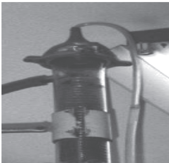
Fig. 1. Línea de succión del sistema de muestreo activo para la recolección de emisiones en la torre de destilación por platos.

Otro componente de la línea de muestreo, es la bomba de vacío de anillo líquido modelo WRP24, la cual creará el vacío para que la corriente de aire pase por el sistema de colección. Se fija en 6 el número de vueltas en la válvula de succión en la bomba, para garantizar un flujo uniforme y continuo.